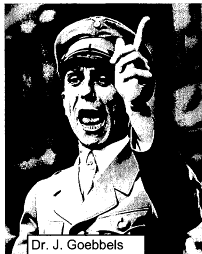
Dr. J. Goebbels

Besonders die Jugend wurde ideologisch gedrillt. Die Burschen wurden zur „ HJ “ ( H itler J ugend), die Mädchen zum „ BDM “ ( B und d eutscher M ädchen) eingezogen. Widerstand war zwecklos!