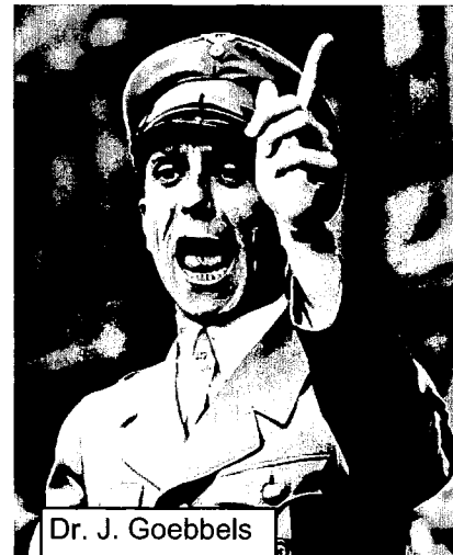
Dr. J. Goebbels

Besonders die Jugend wurde ideologisch gedrillt. Die Burschen wurden zur „ HJ “ ( Hitlerjugend ), die Mädchen zum „ BDM “ ( Bund deutscher Mädchen ) eingezogen. Widerstand war zwecklos!